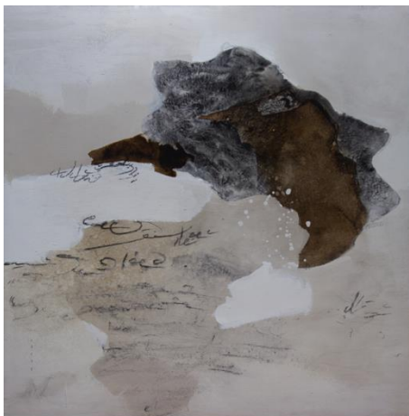
Emel Aflak, Limitless 01 , 2021 Mischtechnik auf Leinwand

Die Verwendung der Abbildungen ist nur im Rahmen der Berichterstattung zur Ausstellung TAKLA-Förderpreis für junge Kunst aus Syrien in der Guardini Galerie und mit Angabe des jeweiligen Abbildungsnachweises erlaubt.