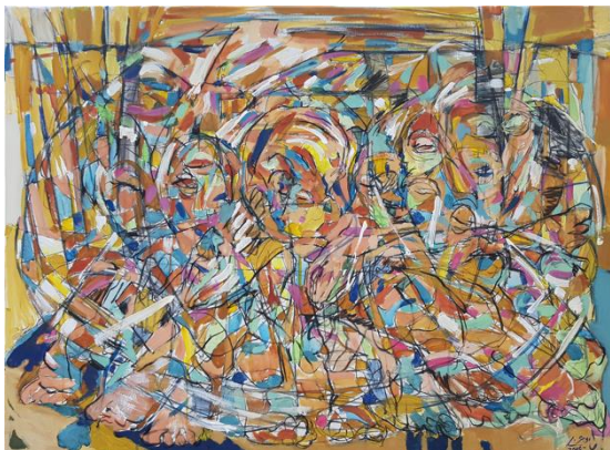
Tarek Arabi, Hiba , 2019 Acryl auf Leinwand