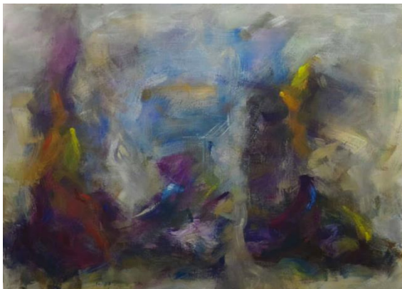
Ali Nzeha, Ohne Titel, 2021 Öl auf Leinwand